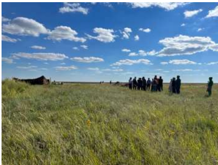
Рис. 2. Пантеон «Аулиелер ордасы» (Ставка святых) Астраханский район, Акмолинской области. Зиарат последователей Примечание: Фото автора

время посещают чаще, приезжают мюриды из других регионов Казахстана Пантеон «Аулиелер ордасы» (Рис. 2).