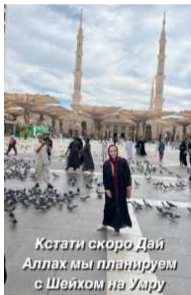
Рис. 3. Из личного аккаунта в сети Instagram последовательницы «Канадских шейхов» в Казахстане 36

В другой казахстанской суфийской группе, последователи посещают мусульманское паломничество-умра из личного аккаунта в сети Instagram последовательницы «Канадских шейхов» в Казахстане (Рис. 3).