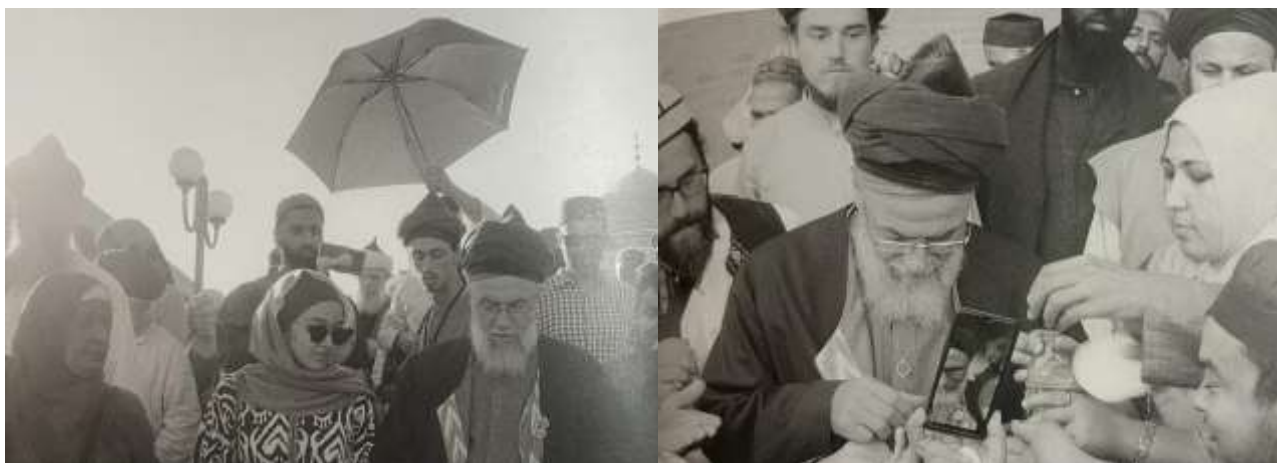
Рис. 1. Фотогалерея к части II Монографии Суфизм после СССР, 2022-ый год, Автор: Ксения Диодорова 35

Помимо этого, в другой суфийской группе широко практикуется посещение шейхом представительств зарубежом, с целью поддержания общины и проведения инициаций в сообщество новых последователей ( байат ). Данный факт подтверждается исследованиями зарубежных ученых, например, К. Диодоровой, которая представила фотогалерею из паломнических путешествий Шейха Мухаммада Мехмет Адиль ар-Раббани в Узбекистан, Казахстан в 2021 году ( Рис. 1 ).